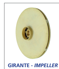
GIRANTE - IMPELLER